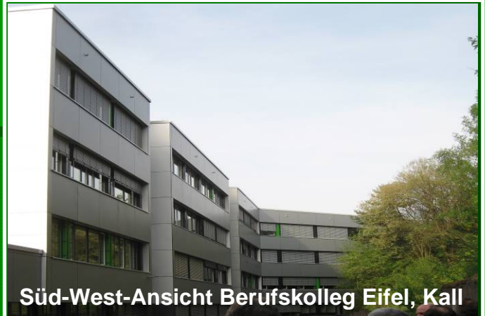
Süd-West-Ansicht Berufskolleg Eifel, Kall